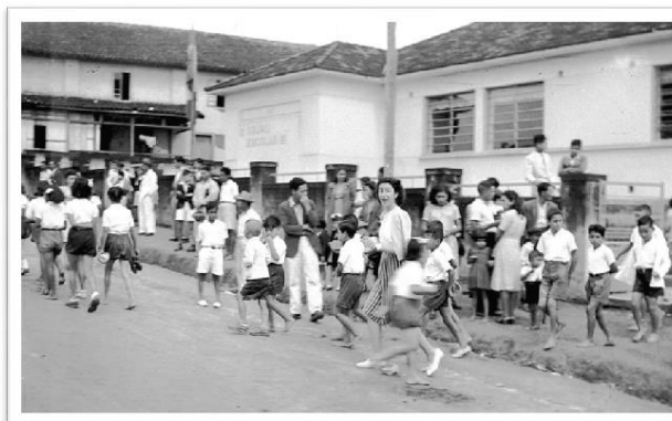
Foto abaixo mostrando-a muito jovem com os alunos do Grupo Escolar .

lecionar em Registro no GRUPO ESCOLAR FRANCISCO MANOEL, atividade que manteve ininterruptamente por mais de 35 anos.